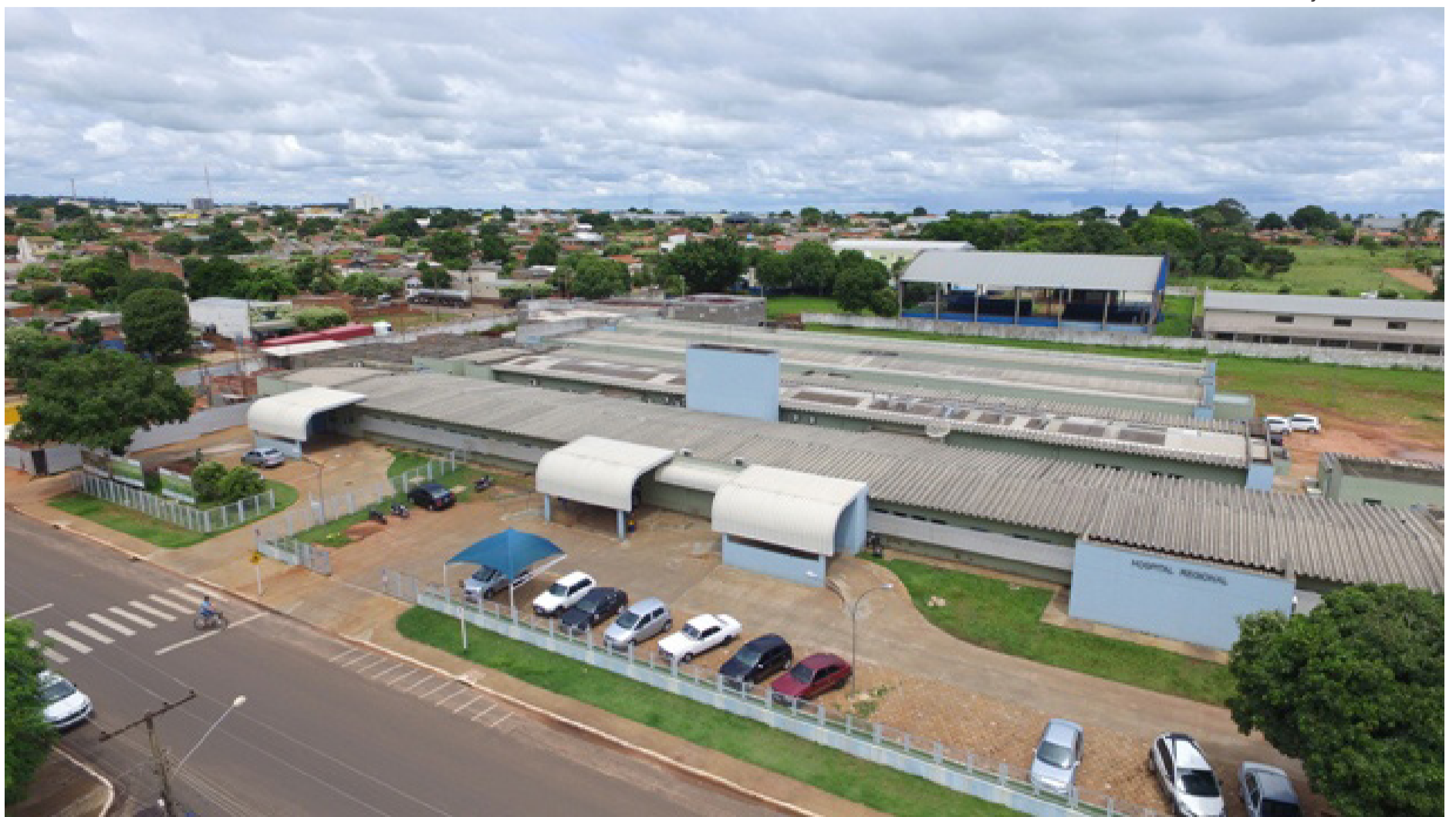
População nova-andradinense ainda fica "refém" da espera de vagas de atendimento especializado, nos casos de maior gravidade, em municípios vizinhos

ação da saúde da paciente piorando, fizeram o assunto ganhar as redes sociais.