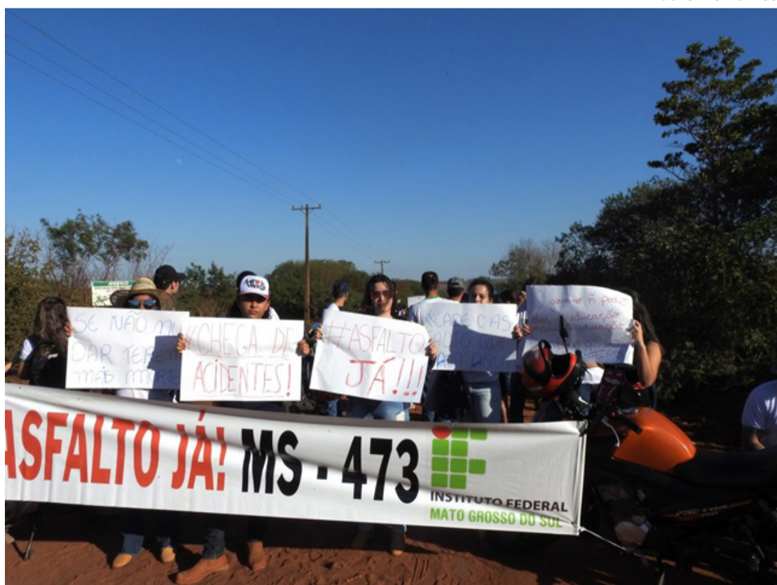
Alunos realizaram manifestação contra o descaso das autoridades com a estrada de acesso ao IFMS