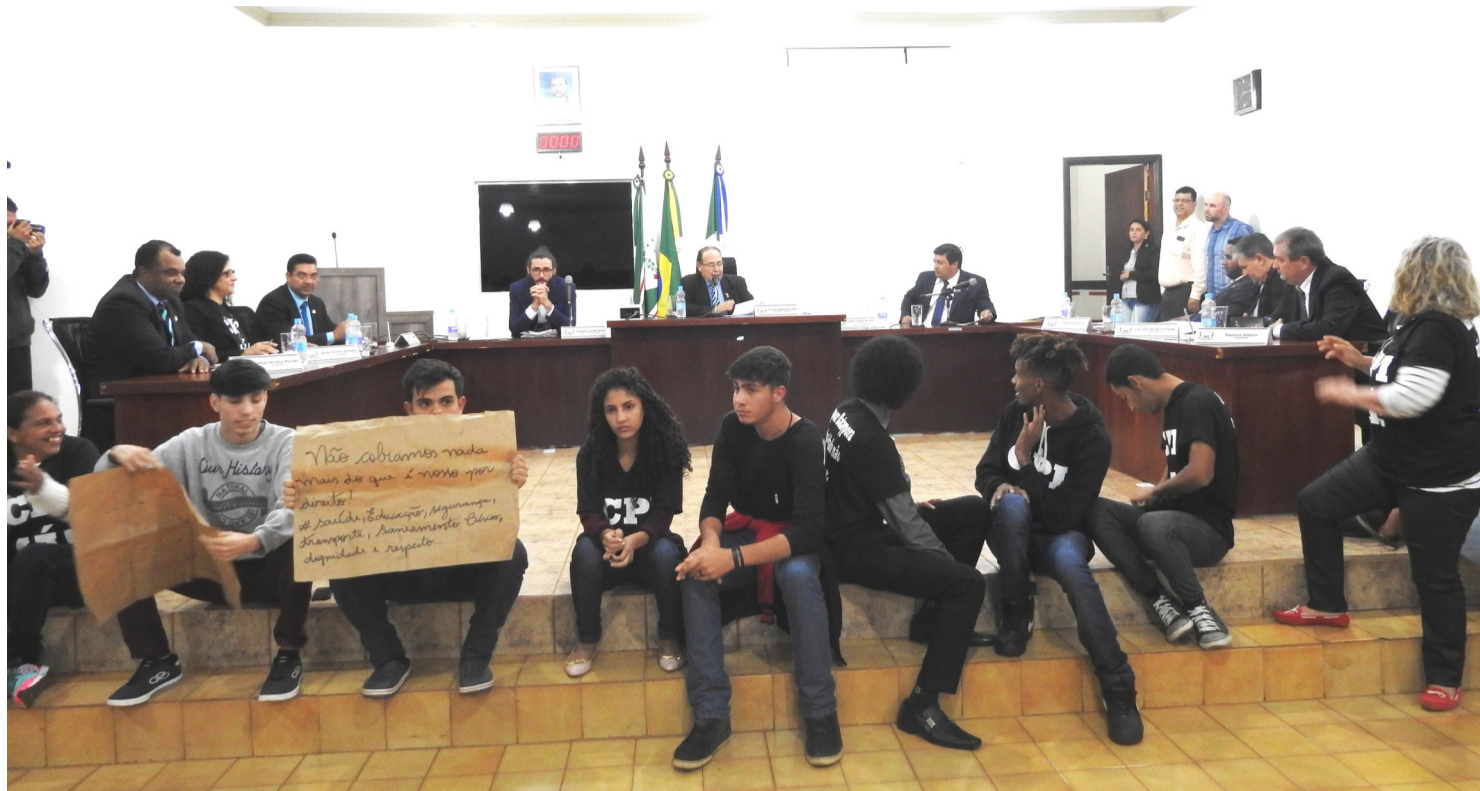
Moradores lotaram a Casa de Leis e cobraram do legislativo a abertura de uma Comissão Parlamentar de Inquérito