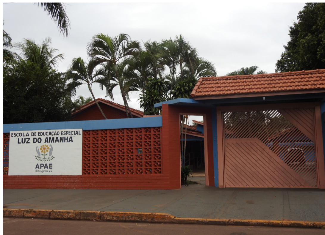
Sede da Associação dos Pais e Amigos dos Excepcionais do município de Batayporã (MS)

O afastamento da diretora e da funcionária partiu da Federação das APAEs do Estado e é por tempo indeterminado. Elas seriam responsáveis por receber as doações. E, até que seja concluída a investigação, vão ficar