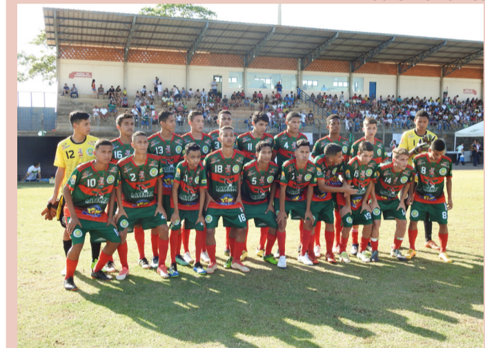
Nova Andradina é a segunda força do Estado no futebol sub-17