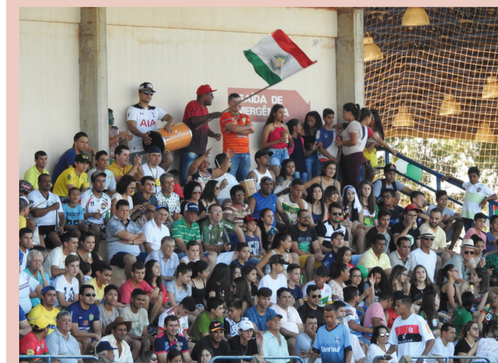
Torcida nova-andradinense deu show durante os jogos