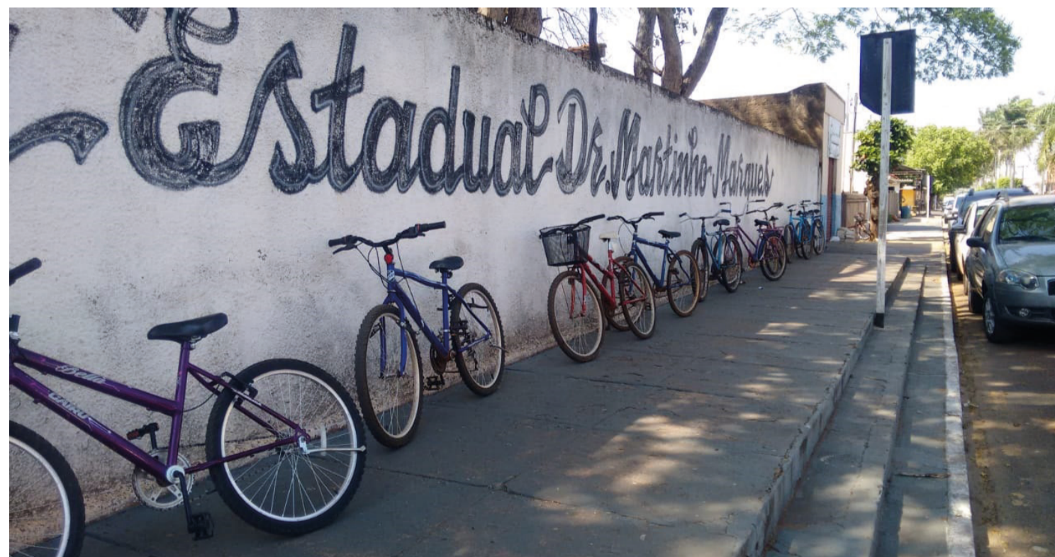
Dezenas de bicicletas são deixadas sem cadeado do lado de fora de escola, assim como em toda a cidade