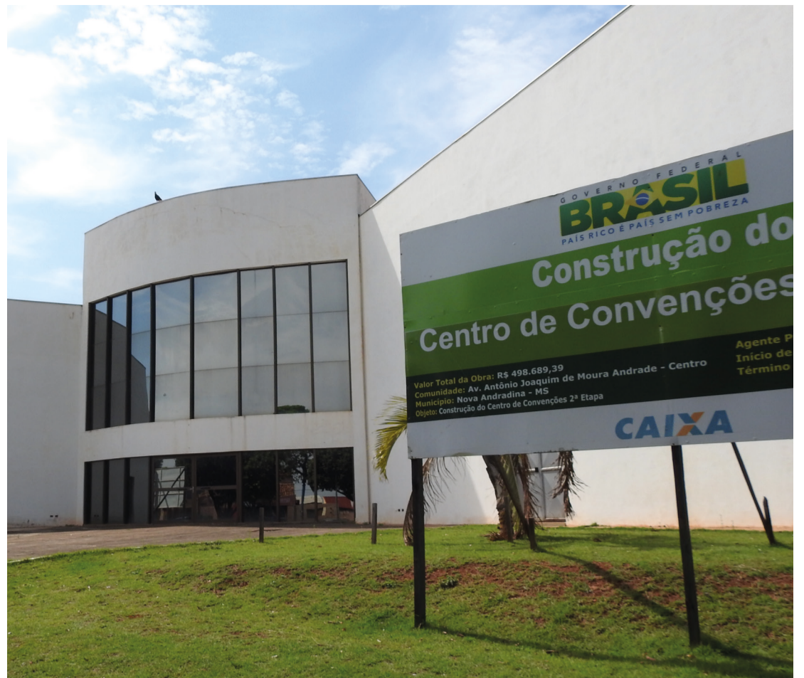
Quarta etapa de obra do Centro de Convenções vai custar quase R$ 800 mil