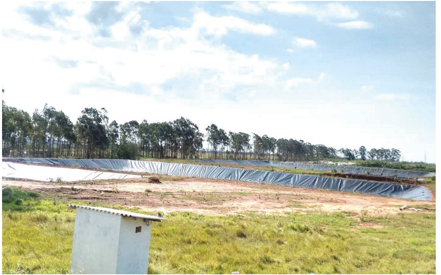
O valor do contrato foi majorado em 23,50% com a mudança na concepção do projeto do aterro sanitário do município

Por conta das divergências detectadas nas dimensões da lagoa, foi