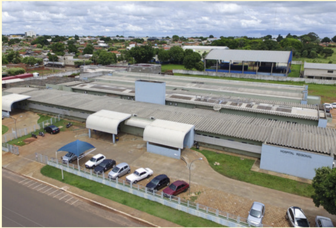
Grande compra de solução de cloreto de sódio seria para atender a demanda do hospital público