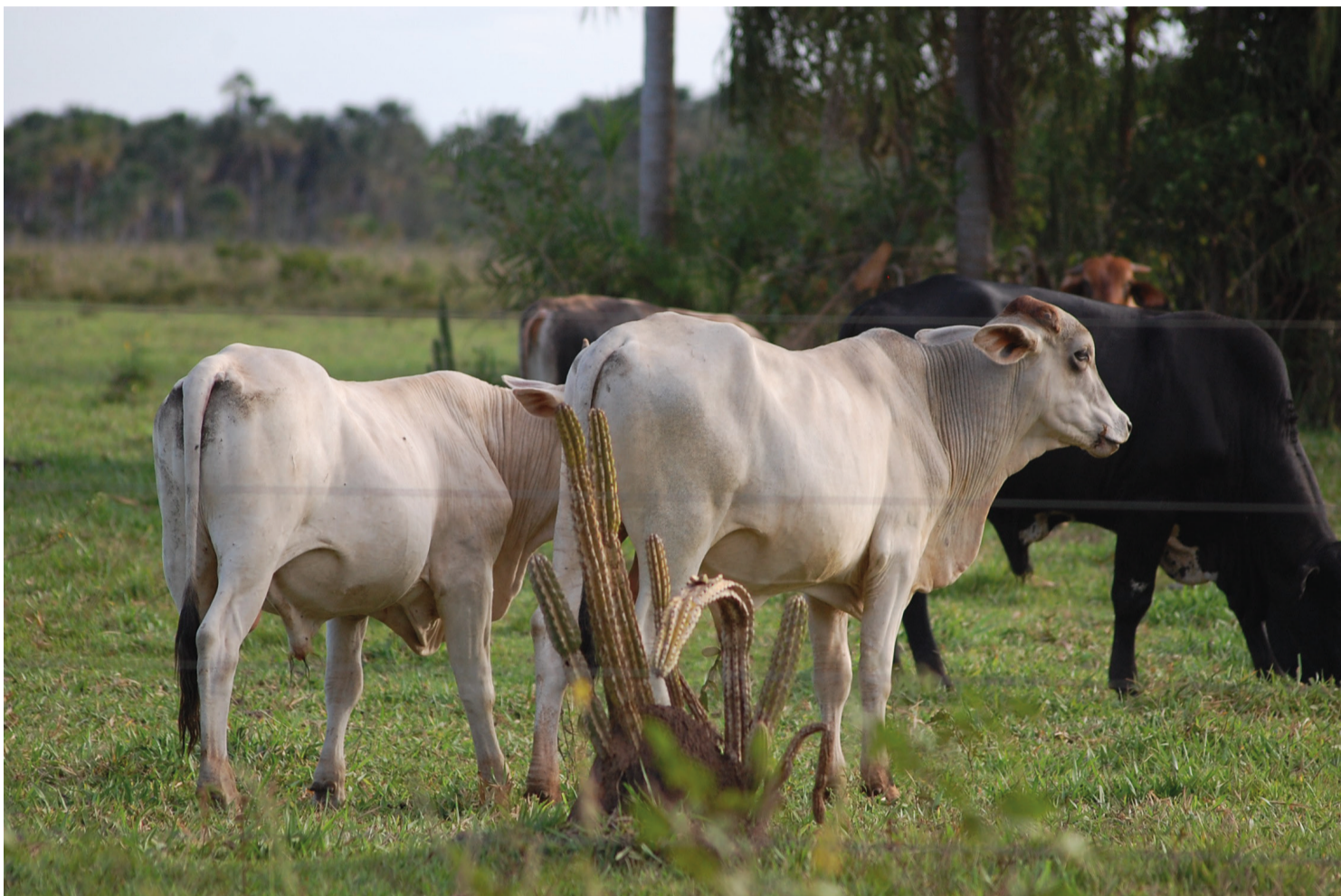
Produtores da região estão tendo dificuldades para engorda de animais e escassez afeta ramo frigorífico na região